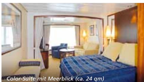
Color-Suite mit Meerblick (ca. 24 qm)