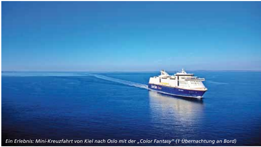
Ein Erlebnis: Mini-Kreuzfahrt von Kiel nach Oslo mit der „Color Fantasy“ (1 Übernachtung an Bord)