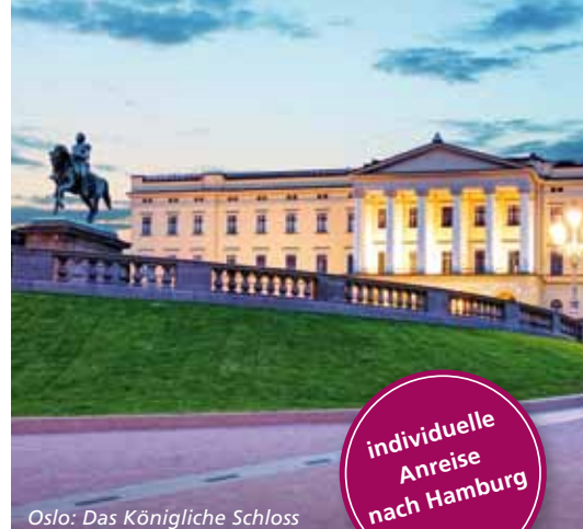
Oslo: Das Königliche Schloss