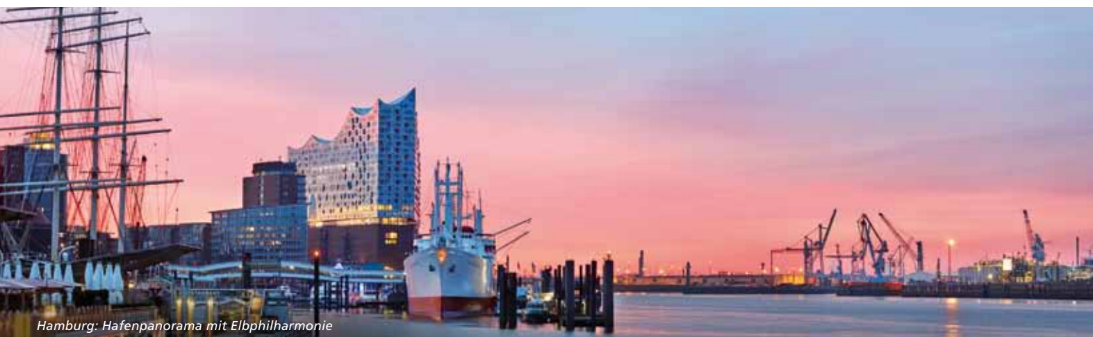
Hamburg: Hafenpanorama mit Elbphilharmonie

Norwegian National Opera Orchestra Norwegian National Opera Chorus