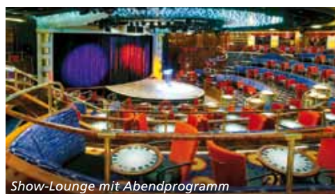
Show-Lounge mit Abendprogramm