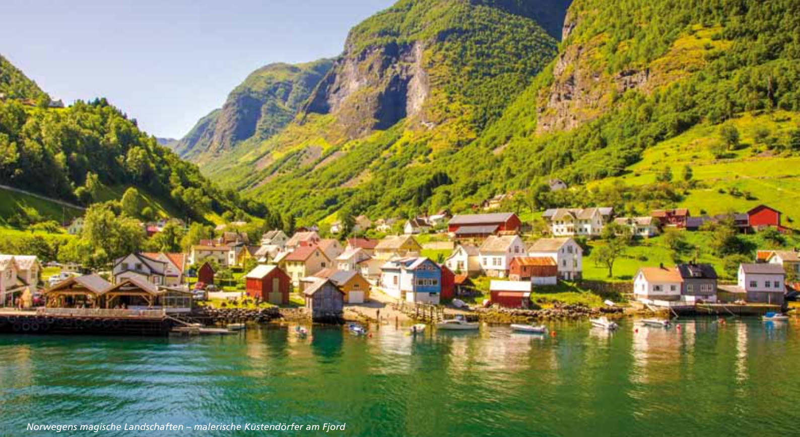
Norwegens magische Landschaften – malerische Küstendörfer am Fjord