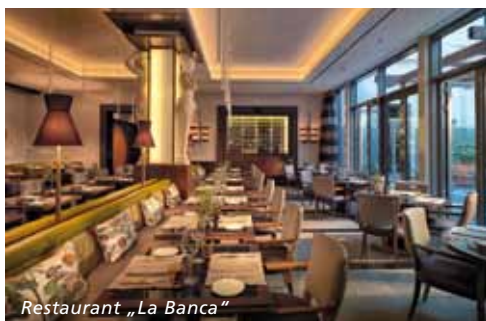
Restaurant „La Banca“