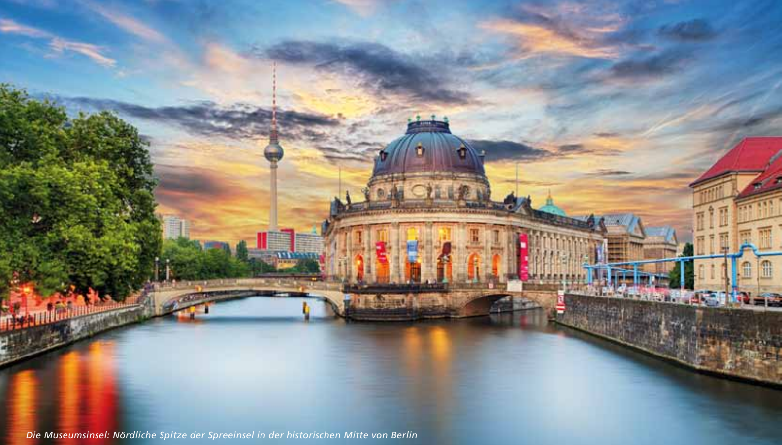
Die Museumsinsel: Nördliche Spitze der Spreeinsel in der historischen Mitte von Berlin